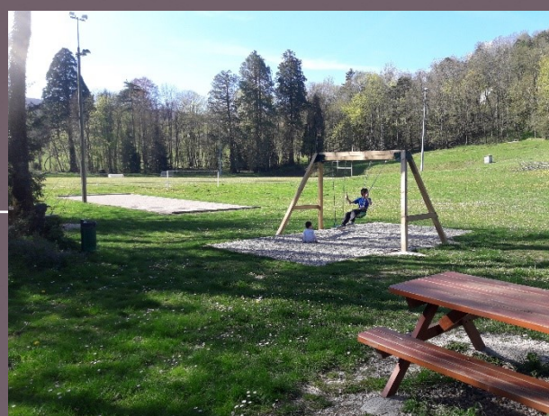
Parc de la Murgière