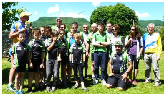
Photo : les enfants de l'école cyclo entourés de leurs accompagnateurs, lors de leur participation à la randonnée de Coublevie.

Pour plus de renseignements, connectez-vous au site du Club http://massieucyclo.ffct.org ou contacter le 06 82 35 43 53.